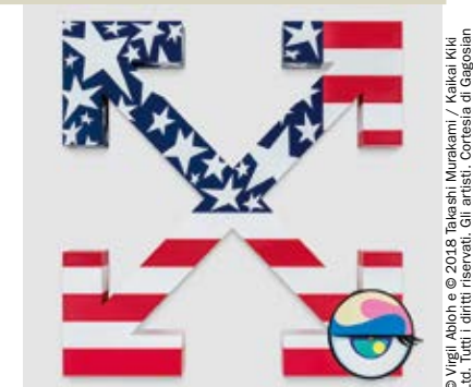
«TIMES: AMERICA TOO» (2018) di Takashi Murakami & Virgil Abloh

Takashi Murakami multimediale, tra pop e filosofia nipponica