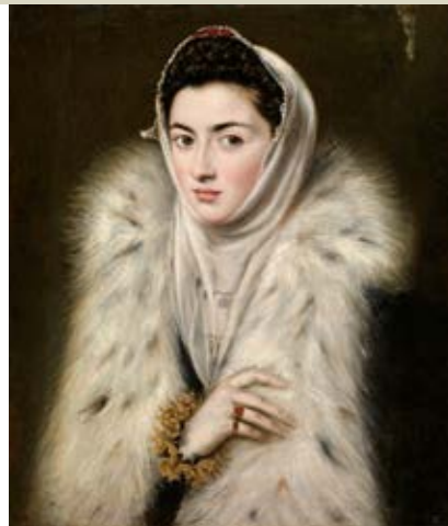
«Signora in pelliccia» (1580-88 ca) di Alonso Sánchez Coello (attribuito a El Greco), Stirling, Glasgow Museums e «Mme Canals (Benedetta Bianco)» (1905), Barcellona, Museu Picasso

I debiti (riconosciuti) di Picasso con El Greco, da lui visto come modello e uguale