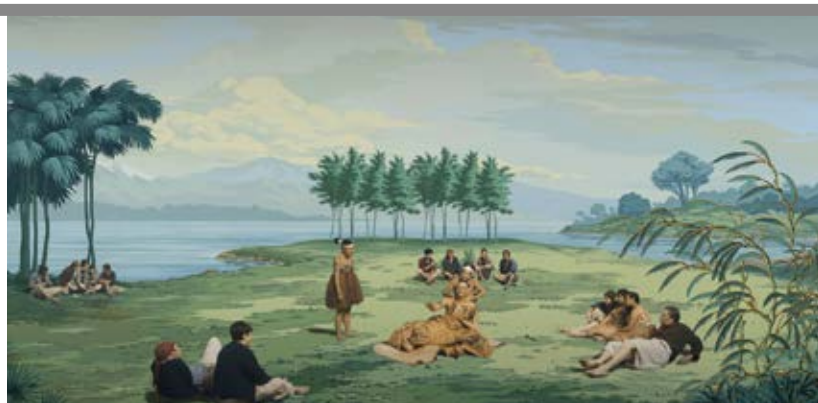
Un fotogramma del video «In Pursuit of Venus [infected]» (2015-17) di Lisa Reihana

Sydney (Australia). Sull'onda del riconoscimento internazionale per le pratiche di artisti contemporanei indigeni e First Nations (basti pensare a grandi progetti espositivi itineranti come «Hearts of Our People: Native Women Artists», in mostra alla Renwick Gallery di Washington fino al 17 maggio; cfr. lo scorso numero, p. 19), la ventiduesima Biennale di Sydney , la terza rassegna d'arte più vecchia al mondo, dopo Venezia e San Paolo, punta i riflettori sulla produzione culturale di comunità native internazionali. A cura dell'artista indigeno australiano Brook Andrews , « NIRIN », che nella lingua degli aborigeni Wiradjuri significa «bordo» o «confine», raccoglie i lavori di oltre cento artisti da Australia, America, Africa e Asia, le cui prati-