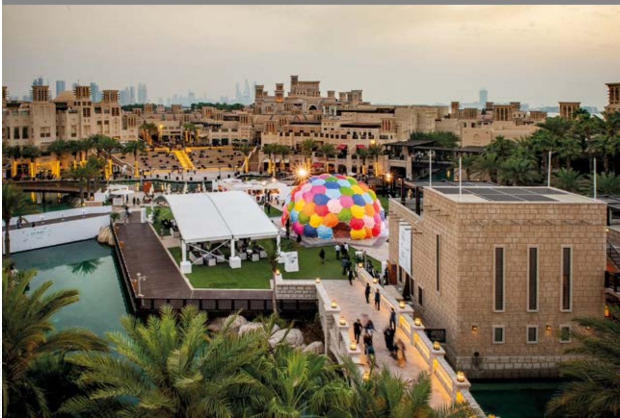
«Solaroca» di Opavivará, un'opera di Art Dubai Commissions per l'edizione 2019 di Art Dubai