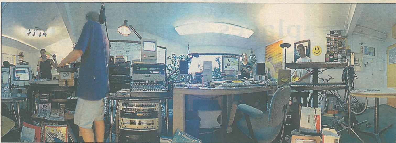
Pinchadiscos de música tecno en plena actuación en Internet.