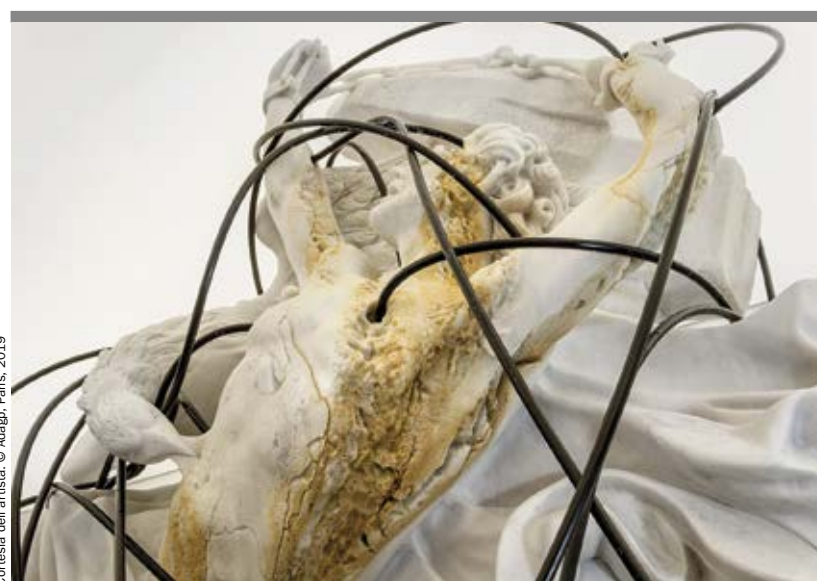
Un particolare di «Prometheus Delivered» (2017) di Thomas Feuerstein