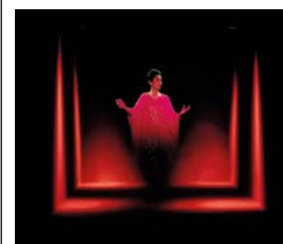
«Opera (QM. 15)» (2016) di Dominique Gonzalez-Foerster, Thyssen-Bornemisza Art Contemporary Collection

Nel Museo Thyssen entra l'arte contemporanea di Francesca Thyssen