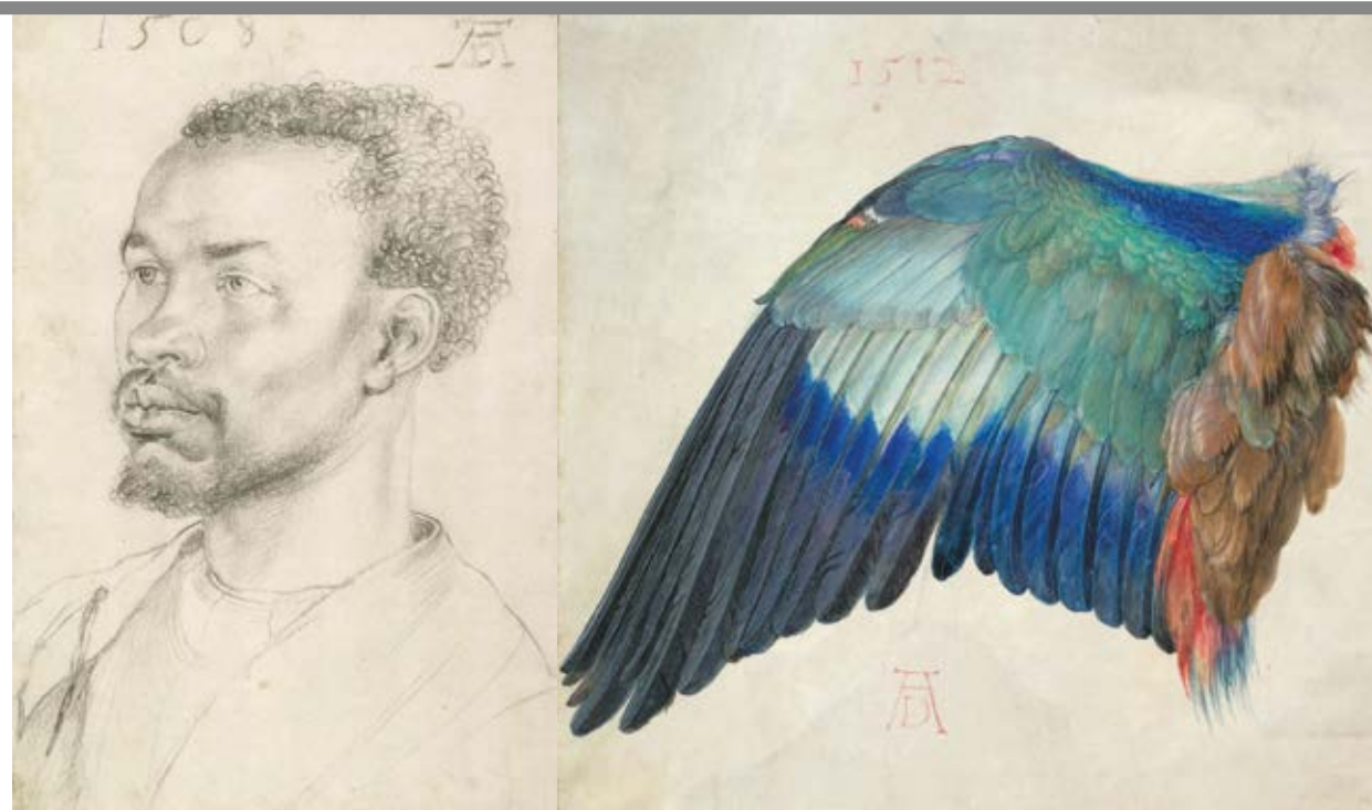
«Ritratto di africano» (1508) e «Ala di ghiandaia marina» (1500 ca) di Albrecht Dürer, Vienna, Albertina

L'Albertina dispone della più vasta collezione al mondo di disegni di Dürer (140) e la nuova mostra ne espone 100, assieme a 25 grafiche, completando il percorso con altri 50 disegni e 12 dipinti provenienti dalle maggiori collezioni internazionali. In mostra sono fogli dall'Apocalisse, dalla Grande Passione, dalla Vita della Vergine, studi per l'altare Heller, studi di ani-